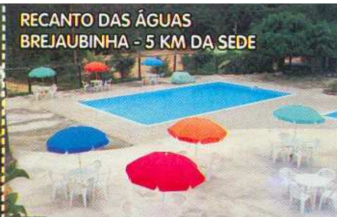
RECANTO DAS ÁGUAS BREJAUBINHA - 5 KM DA SEDE