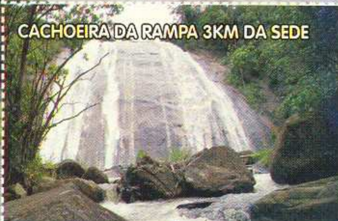
CACHOEIRA DA RAMPA 3KM DA SEDE