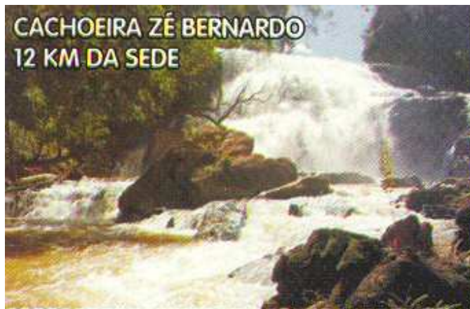
CACHOEIRA ZÉ BERNARDO 12 KM DA SEDE