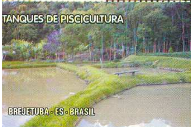
TANQUES DE PISCICULTURA