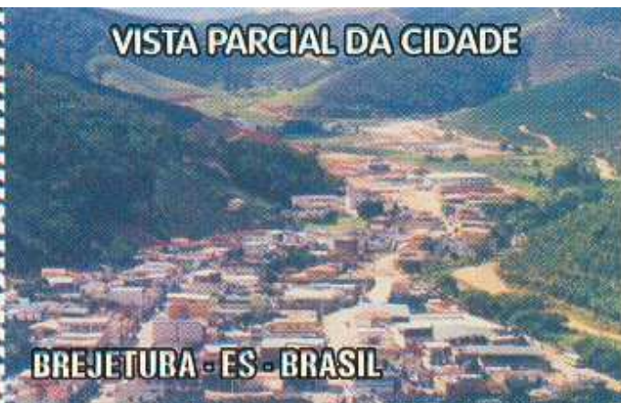
BREJETUBA - ES - BRASIL